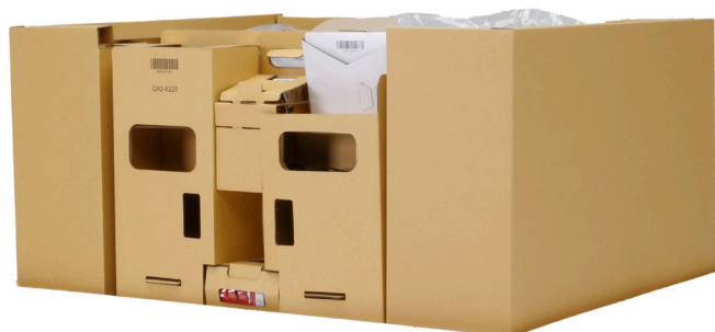
EPS-vrije (piepschuim) verpakking voor TM-serie, PRO-2600 en GP-2600S